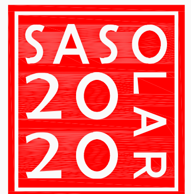
Imagen sujeta a posibles modificaciones de orden técnico y/o requerimientos legales